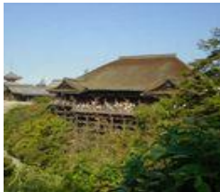
Cliché : WabyanKo

WabyanKo, dans la correspondance citée plus haut, évoque régulièrement ses dessins, ses carnets de voyage. Alternant photographies et dessins, le carnet de voyage rapporté du Japon montre à la fois comment Wabyanko crée le décor d'un programme tel que Kyototicha , et en quoi le dessin constitue le moment essentiel de la création.