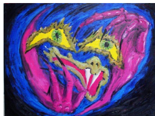
Requin bleu et poisson orange