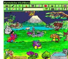
Le jeu vidéo Kyototicha

Le dessin précipite, par effet de mouvement tournant, le moment à partir duquel, se saisissant de la réalité, l'imagination imprime à cette dernière la forme, ni tout à fait la même ni tout à fait une autre, qui est celle d'une vision.