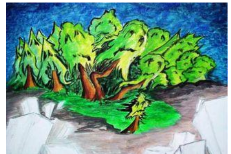
Forêt et cristal

Induisant la naissance d'un univers graphique très personnel, la création de programmes tels que Waquarium , SushiMiaou , Kyototicha , déplace le centre de gravité du programming concept du côté de l'art. Le phénomène illustre une propriété de la création programmatique que l'on oublie trop souvent : la dite création a pour fondement ou raison le besoin d'expression, lequel engage, dans le secret de l'intime, l'existence toute entière du créateur.