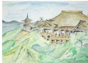
Kyomezudera temple Kyoto